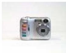
Nikon Coolpix 2200