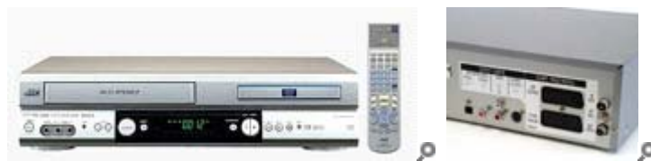
JVC HR XV 1