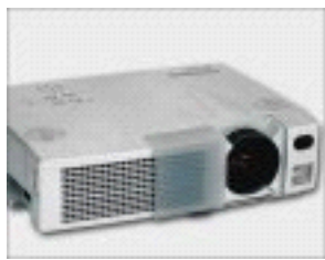
Lieseingang dv 335

Gebühr: für kirchliche Mitarbeiter(innen) €32,- für nichtkirchliche Mitarbeiter(innen) €62,-