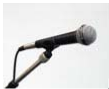
Beyer soundstar mkII

Dynamisches Universal-Mikrofon, für Sprache sehr gut geeignet. XLR Anschluss. Inklusive Stativklemme, Kabel und 3-Bein Stativ. Gebühr: €6,-