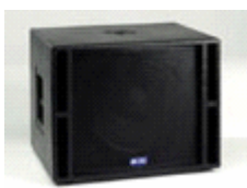
Stage Opera 41.15