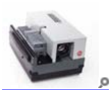
Leitz Pradovit 250