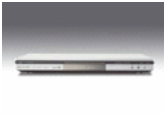
Panasonic DVD-S 75