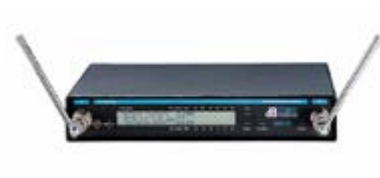
Empfänger PU 910