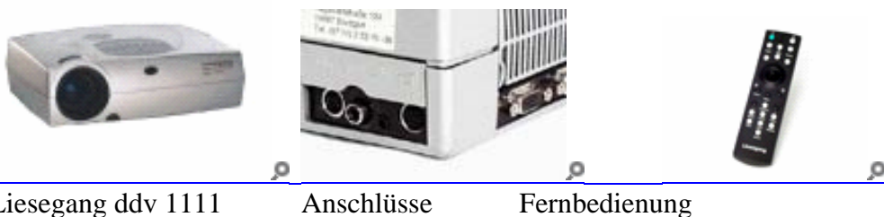
Liesegang ddv 1111

Gebühr: für kirchliche Mitarbeiter(innen) €32,- für nichtkirchliche Mitarbeiter(innen) €62,-