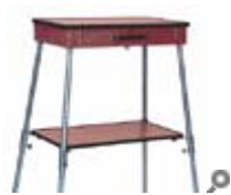
KarBa Tisch aufgebaut