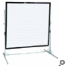
MW Fast Fold

Alle drei Leinwände mit zusammenklappbarem Rahmengerüst, Standbeinen und Transportkoffer. Gebühr je Leinwand: €17,-