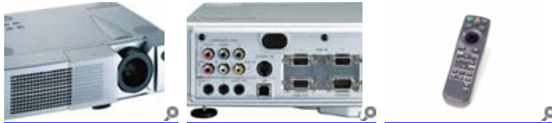
Liesegang dv 365

Gebühr: für kirchliche Mitarbeiter(innen) €32,- für nichtkirchliche Mitarbeiter(innen) €62,-