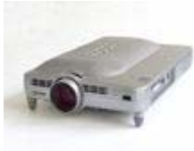
Sharp PG-M20 X