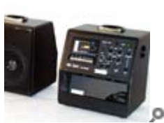
TLS 70 / LS 70